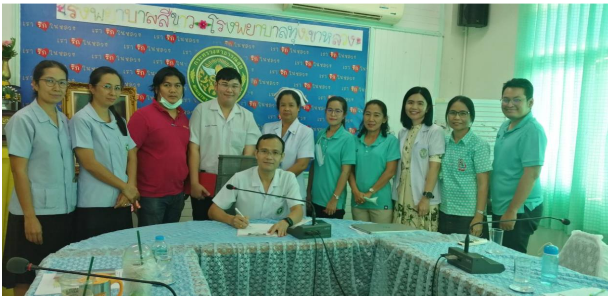
ภาพประกาศ....

- กำมือแนบออกข้างซ้ายตรงหัวใจ แสดงถึงการมี ใจดีในรู้ (R:realise) ต่อปัญหาการทุจริต มุ่งมั่นไปสู่อนาคตข้างหน้า (O:onward) ในการแก้ปัญหาเพื่อความเจริญอย่างยั่งยืนของชาติ แสวงหาพัฒนาความรู้ (N:knoledge) ให้เท่าทันต่อสถานการณ์ และมี ความเอื้ออาทร (G:generosity) ต่อกันบนพื้นฐานของจริยธรรมและกฎหมาย สอดคล้องกับโมเดลประเทศไทยสู่ความมั่นคง มั่งคั่ง และยั่งยืน (Thailand ๔.๐)